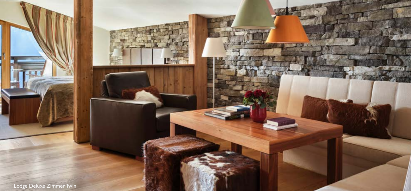
Lodge Deluxe Zimmer Twin