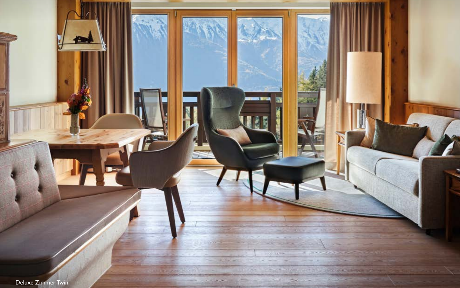
Deluxe Zimmer Twin